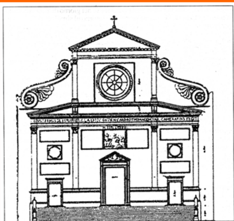
Paul Letarouilly: facciata della chiesa di S. Agostino.

La tela esposta, esaltata da una splendida tecnica luministica come le altre due della cappella, è del 1602 ed è la seconda versione dopo che la prima (distrutta durante la seconda guerra mondiale) era stata rifiutata perché San Matteo, oltre ad essere presentato in modo non ritenuto consono al suo ruolo, piuttosto che essere ispirato dall'Angelo ne era materialmente guidato. Non è questione di poco conto se si pensa che, in un periodo di violenti contrasti con i Luterani, era pericoloso solo ipotizzare che i fedeli potessero leggere e interpretare i testi sacri senza la mediazione del clero: rappresentare quindi uno degli evangelisti, piuttosto che come un interprete della parola del Signore, come un semplice esecutore meccanico poteva apparire come uno sminuire il ruolo dei predicatori e, di riflesso, delle gerarchie ecclesiastiche. La versione attuale è sicuramente più in linea con queste esigenze ma Caravaggio ha forse affidato a un particolare la sua critica irridente nei confronti delle gerarchie ecclesiastiche. L'imponente Matteo poggia infatti il ginocchio su uno sgabello che, con un mirabile effetto di trompe l'œil, vacilla oltre la piattaforma e sembra in procinto di franare.