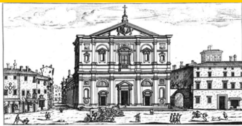
CHIESA DI SAN LUIGI DEI FRANCESI ET HOSPEDALE DELLA NATIONE. nel Rione di S. Ighazio. Architettura di Giacomo della Porta.